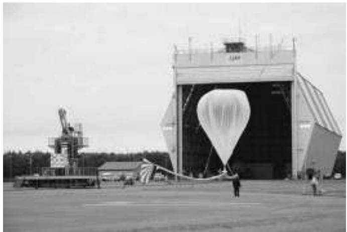
大樹町多目的航空公園と実験の様子