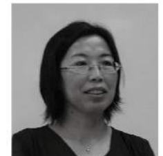
迎 春 氏