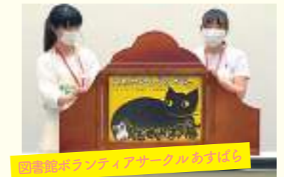
図書館ボランティアサークルもすはく

本学のサークル活動では、地域のイベントに参加したり、幼稚園や保育所、高齢者施設などに訪問して活動するなど、サークルを通して地域の方との交流を深める機会が多くあります。学生たちは、自分自身の成長にもつながる場として、積極的にサークル活動に参加しています。