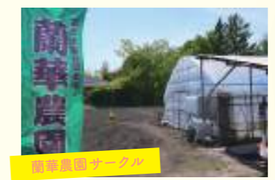
蘭華農園サークル

バドミントンサークルは、週に1~2回運動不足の解消を目的に、初心者・経験者関係なく楽しく交流しながら自由にプレーしています。高校の部活とは違い、メンバー同士で連絡を取り、集まれる日時を設定し活動しています。