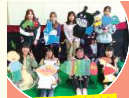
人形劇サークルありんこ

帯広大谷短期大学のサークルに参加して、充実した学生生活を過ごそう！ 仲間と過ごす時間は、きっとかけがえのない思い出になるはず。