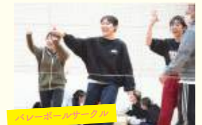
バレーボールサークル

主な活動は、図書館や地域イベントでの読み聞かせです。読み聞かせは、最初は緊張しますが、子どもたちの笑顔を見ることができて、とてもやりがいを感じます。読み聞かせ以外では、ポップ作りや選書ツアーもっており活動内容は多岐にわたります。