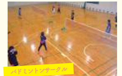
バドミントンサークル

バレーボールを通して楽しみながら体を動かすことを目的とし、体育館で活動しています。経験、未経験は関係なく、男女混合で和気あいあいとプレーしています。ボールをつないで落とさないという共通の思いを持ち、日々熱いラリーが続いています。